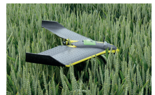
Innovation technologique (Drone)